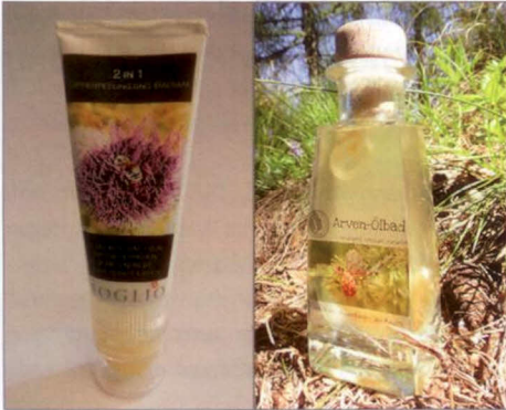
Abb. 3 links: Produktentwicklung, Lippenpeeling und -balsam mit dem Honig der schwarzen Biene (»pro specie rara«)

rechts: Produktentwicklung, Arven-Ölbath mit Arvenholzextrakt und typischem Arvenholzduft zur Entspannung