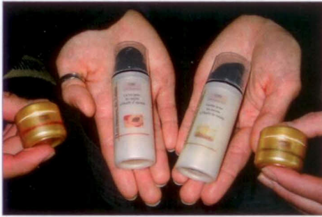
Abb. 1 Produktentwicklungen der Studierenden 2009 Think-Tank »Wallis« (saisonale Handcreme mit einer Winter- und Sommerpflege)

Anspielungen auf typische regionale Produkte aus der Landwirtschaft, wie Aprikosen (Kernfragmente, Kernöl), Traubenkerne (Mehl und Öl), ätherische Öle aus Alpenkräutern, Gletschersand und weitere (Abb. 1).