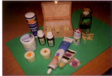
Abb. 4 Produktentwicklungen der Studierenden 2012 Think Tank »Soglio«

Die gemachten Erfahrungen der Studierenden bei der Ideensammlung wie auch bei